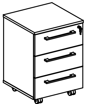
Схема сборки тумбы мобильной AMC 3D